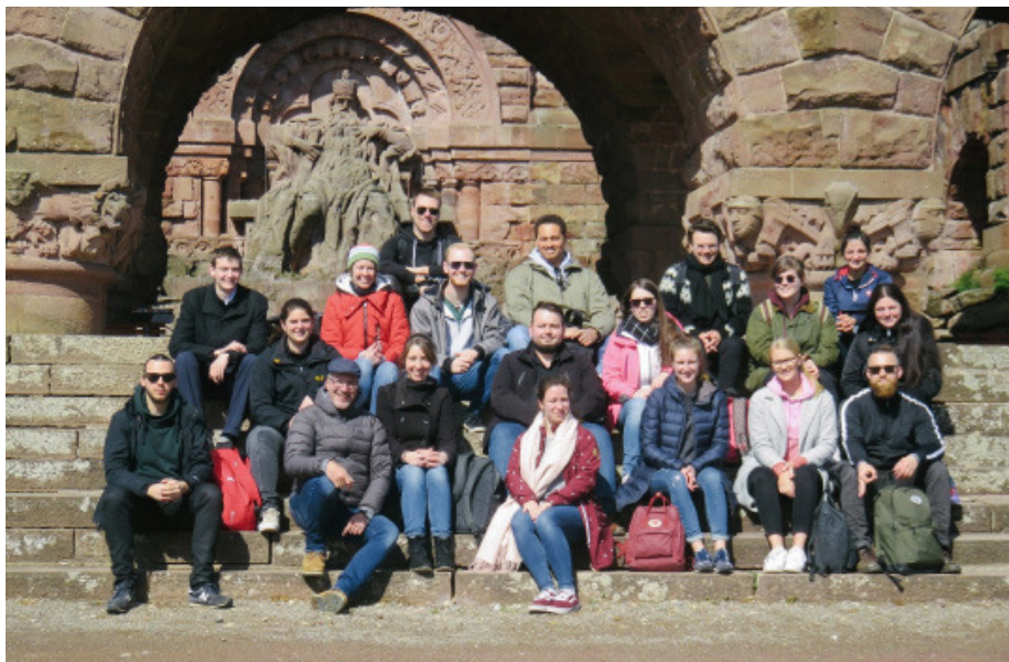
Abb. 1: Exkursionsgruppe vor dem Kyffhäuser-Denkmal

anfänglich überhaupt nicht Ausdruck fürstlich-landesherrlicher Pracht war, sondern vielmehr aus der Notwendigkeit heraus entstand, eine eigene Residenz zu besitzen. In der anschließenden Führung durch das weitläufige, teils museal genutzte Schloss erhielt die Gruppe Einblicke in die opulente Sammlung der Kunstschätze. Einen Höhepunkt stellte das bis heute bespielte Barocktheater aus dem 17. Jahrhundert mit der noch vollständig erhaltenen und funktionsfähigen Bühnenmaschinerie dar.