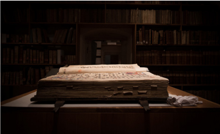
Abb. 2: Chorbuch mit Prachthand- schriften des 16. Jahr- hunderts im Naumburger Domstifts- archiv