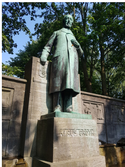
Abb. 2: Bronzestatue von 1912 beim Groth-Brunnen in Kiel

Wer sich mit Klaus Groth als Dichter, Wissenschaftler und Persönlichkeit des 19. Jahrhunderts beschäftigt, wird im Sinne eines interdisziplinären Austausches neben der Literatur- und Sprachwissenschaft stets auch die Historiographie miteinzubeziehen haben, um gewinnbringende Erkenntnisse erzielen zu können. Dass dies selbstverständlich nicht ausschließlich für Groth gilt, sollte offensichtlich sein: So dürfte etwa aufgrund der Konzentration auf die literarischen Werke auch in Historikerkreisen weitgehend unbekannt sein, dass sich Theodor Fontane (* 1819; † 1898), dessen 200. Geburtstag ebenfalls im Jahre 2019 begangen wird, 24 in seiner Funktion als Kriegsberichterstatter ausführlich mit den Herzogtümern Schleswig und Holstein sowie dem Deutsch-Dänischen Krieg auseinandersetzte.