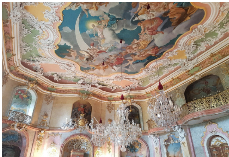
Abb. 3: Fest- saal auf Schloss Heidecks- burg in Rudolstadt

Herrschaftssitze für die regierende Obrigkeit besaßen. Neben dem eindrucksvollen Schlossgebäude mit den einzelnen Wohnräumen, dem barocken Festsaal und einer Waffensammlung konnte insbesondere die Ausstellung „Rococo en miniature“ mit ihren von Gerhard Bätz und Manfred Kiedorf angefertigten, kleinformatischen Schlössern und Figuren aufgrund der Liebe zum Detail begeistern.